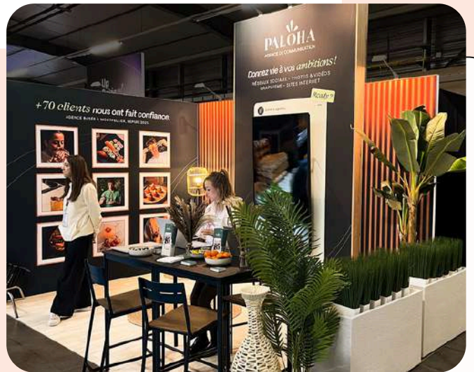
Paloha - 12m 2 Salon Siphro - 300€/m 2