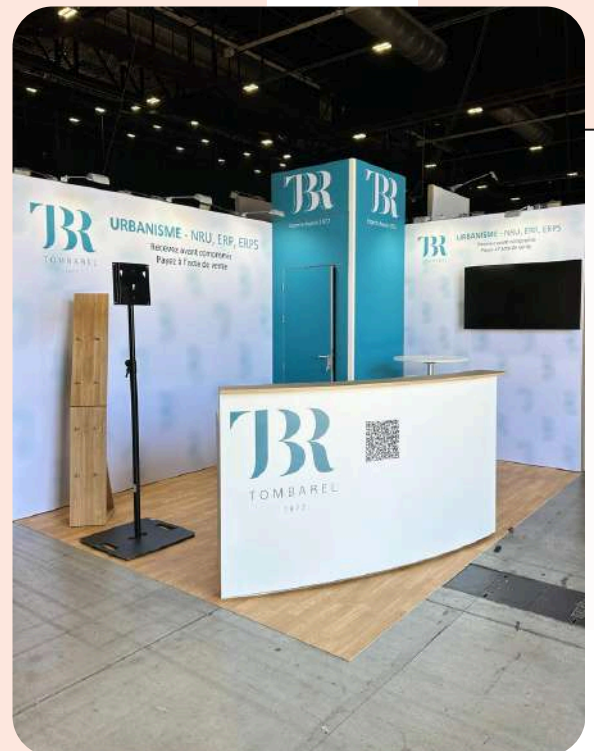
Tombarel - 12 m 2 Congrès Notaires - 275€/m 2