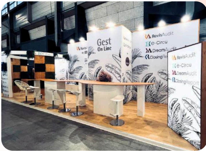
Gest On Line - 36m 2 Congrès Experts comptables - 400€/m 2