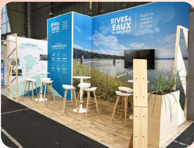
Rives et Eaux du Sud Ouest - 21 m 2 Foire Agri Tarbes - 300€/m 2