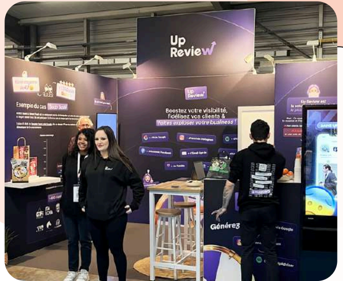
UpReview - 12m 2 Salon Siphro - 300€/m 2