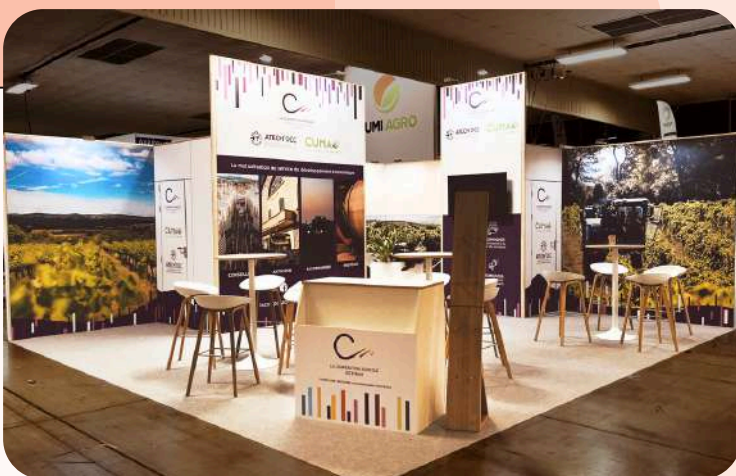
Coopération agricole - 21 m 2 Salon Sitevi - 300€/m 2