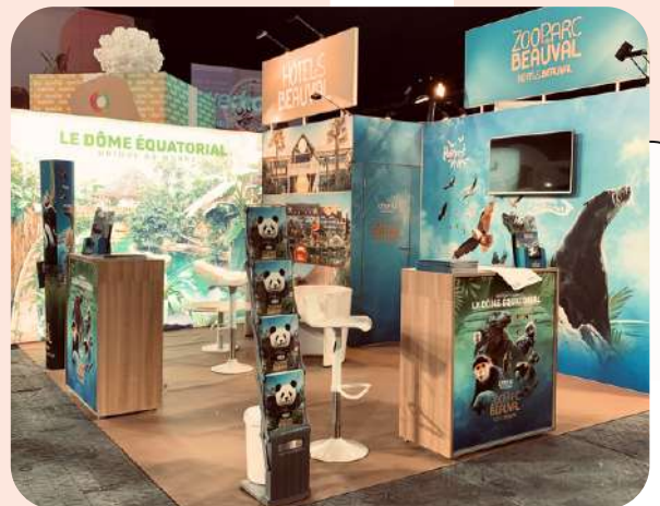
Zoo de Beauval - 100 m 2 Salon Siphro - 250€/m 2