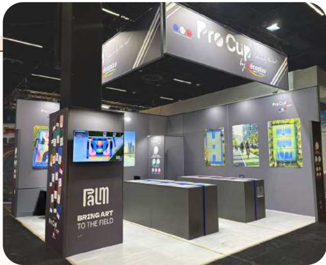
Théaulor - 39m 2 Salon FSB - 480€/m 2