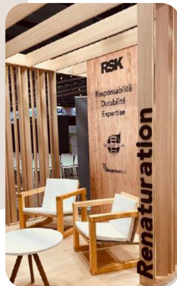
RSK - 50 m 2 Salon Pollutec