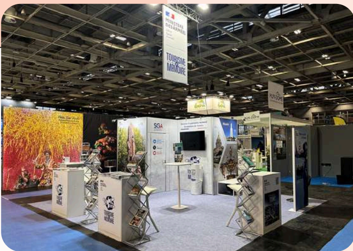
Ministère des Armées - 30 m 2 - Salon Tourisme (MAP) - 300€/m 2