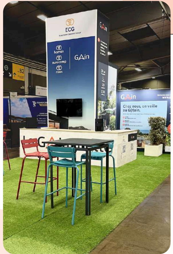
GAIN - 9 à 55 m 2 5 salons en France - 275€/m 2