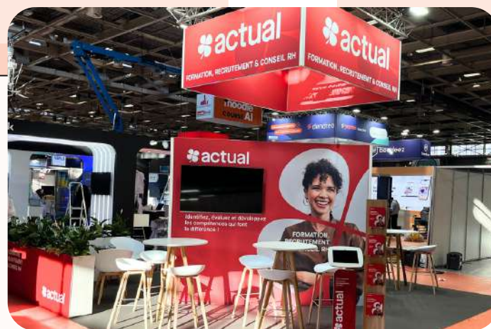
Groupe Actual - 36 m 2 salon RH - 380€/m 2