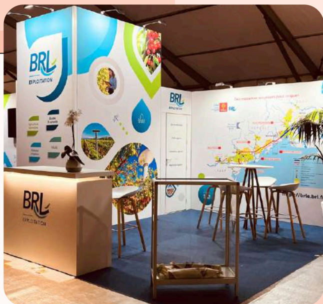
BRL - 32 m 2 Salon Sitevi - 380€/m 2