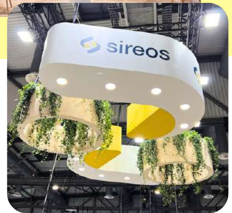
Sireos - 54 m 2 Salon Energia