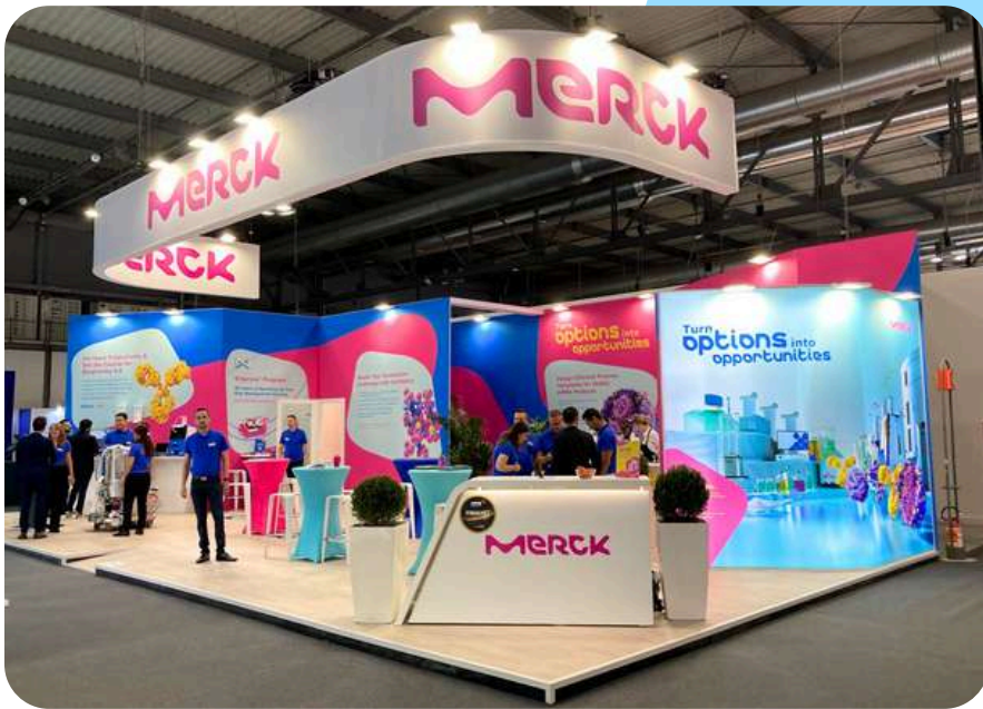
Merck - 36 à 180 m 2 Salons en Europe