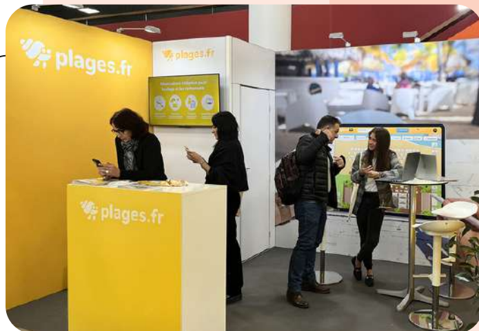
Spiagge / Plages.fr - 12 m 2 Salon Siprho - 230€/m 2