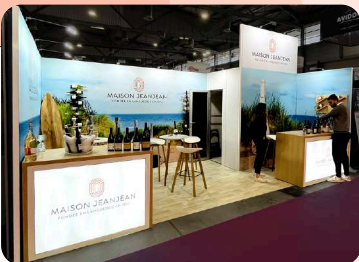
Maison Jeanjean - 18 m 2 Salon Siphro - 380€/m 2